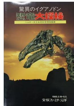
恐竜展リーフレット 『驚異のイグアナドン 恐竜大探検 ベルギー王立自然科学博物館展』 (1988年)