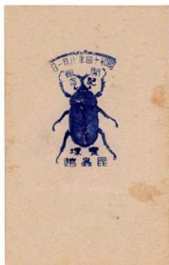
宝塚昆虫館 昆虫スタンプ (1939年)