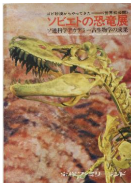
恐竜展リーフレット 『ゴビ砂漠からやってきた ＜世界初公開＞ソビエト恐竜展 ソ連科学アカデミー古生物学の 成果』(1973年)