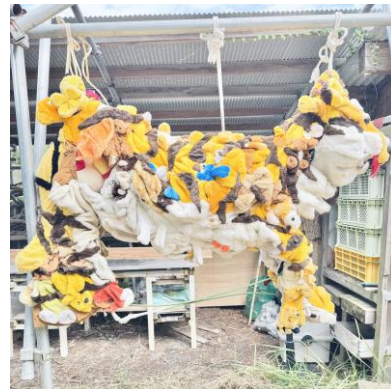
藤浩志 《ぬいぐるみ〜ズ・虎》2022年、 木材・いらなくなったぬいぐるみ、 H1150×W400×D1500