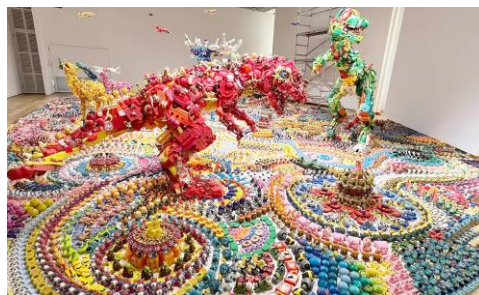
過去展覧会の様子