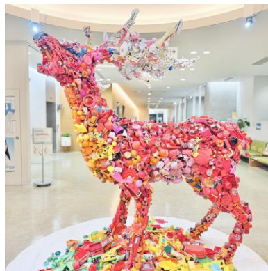
藤浩志 《嘆きのメガロケロス・白角赤太郎》 2021年、木材・いらなくなったおも ちゃ、H2340×W1510×D2100